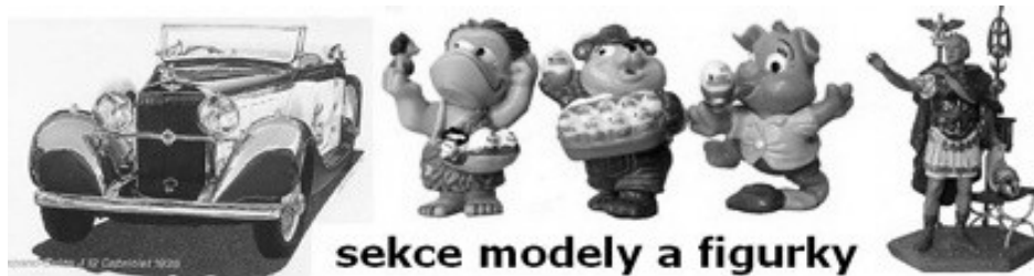
sekce modely a figurky