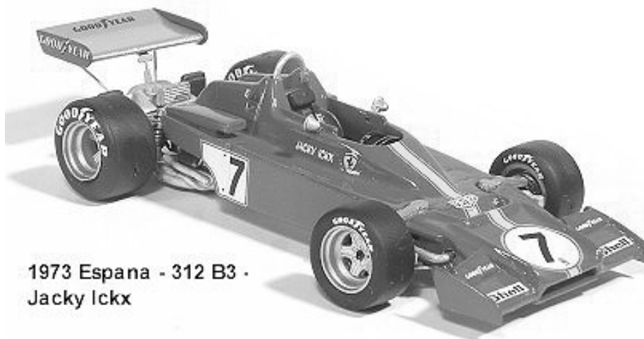
1973 Espana - 312 B3 - Jacky Ickx