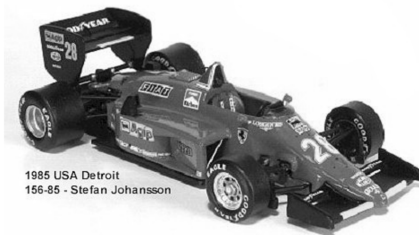
1985 USA Detroit 156-85 - Stefan Johansson